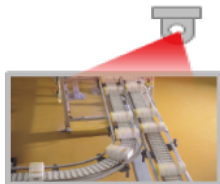
事務所内の監視映像